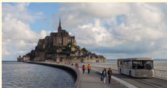
Le pont-passerelle, le nouvel accès au Mont-Saint-Michel.