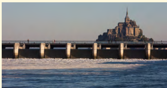
Le barrage, un point de vue unique sur le Mont-Saint-Michel

Dans le cadre du rétablissement du caractère maritime du site, le nouvel accès offre une approche complètement repensée pour les visiteurs. Une nouvelle digue (1085 mètres), légèrement décalée par le pont-passerelle en fin de parcours (760 mètres).