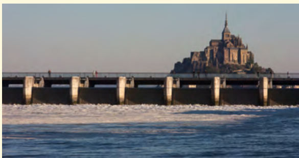
De dam, een uitzonderlijk uitkijkpunt op de Mont-Saint-Michel

De in mei 2009 in gebruik gestelde waterkering van Le Couesnon regelt de waterstand en geeft de rivier zo voldoende kracht om het sediment naar zee af te drijven. Naast deze hydraulische functie, maakt de dam volledig deel uit van de route naar de Mont-Saint-Michel. Het vormt een waar kunstwerk en is gericht op de ontvangst van het publiek. In het kader van het herstel van het maritieme karakter van de site, biedt de nieuwe toegang een volledig herziene benadering voor de bezoekers. Een nieuwe, meer oostelijk gelegen dijk (1.085 meter) gaat aan het einde van de route over in een voetgangersbrug (760 meter).