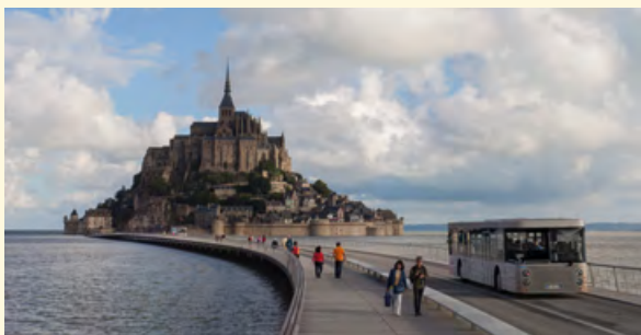
De voetgangersbrug, de nieuwe toegang tot de Mont-Saint-Michel